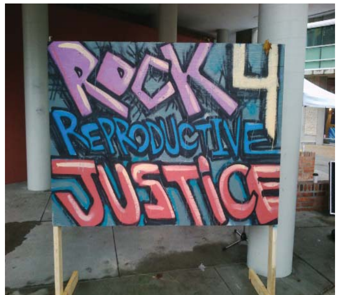
An unnamed volunteer created this awesome sign in support of “Rock for Reproductive Justice”, held in Victoria BC on Oct 22, 2011.