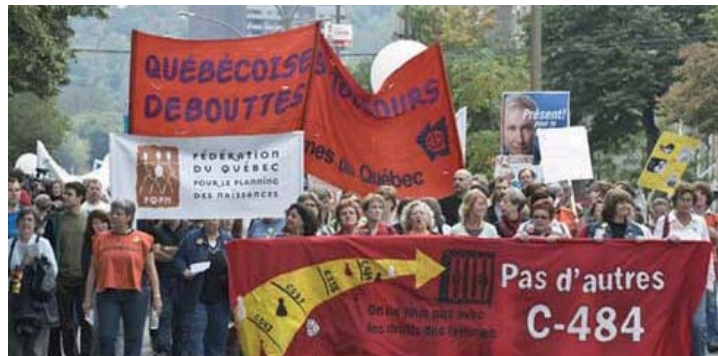
Des manifestants se rassemblent à Montréal afin d'empêcher la réélection des Conservateurs et afin de contrer la loi C-484.

Deux autres projets de loi d'initiative privée déposés au cours de la dernière session ont tenté de restreindre le droit à l'avortement. Le premier aurait protégé le personnel de la santé qui refuse de fournir tout service médical qui leur déplaît personnellement, y compris refuser de fournir tout renseignement ou référence. Un autre projet de loi aurait criminalisé tout avortement pratiqué après 20 semaines, même en cas de graves déficiences fœtales. Ces deux projets de loi sont une répétition de tentatives précédentes. Depuis 1996, il s'est déposé au moins 11 projets de loi ou motions d'initiative privée visant à mettre en danger ou criminaliser l'avortement, habituellement par des députés Conservateurs mais dans quelques cas par des Libéraux. Le projet de loi C-484 a lui-même été d'abord présenté en 2004 par un député Conservateur, Gerry Breitkreuz. La persistance de ces projets de loi est un bon indicateur des sentiments anti-avortement de la majorité du caucus Conservateur et d'une bonne partie du caucus Libéral.