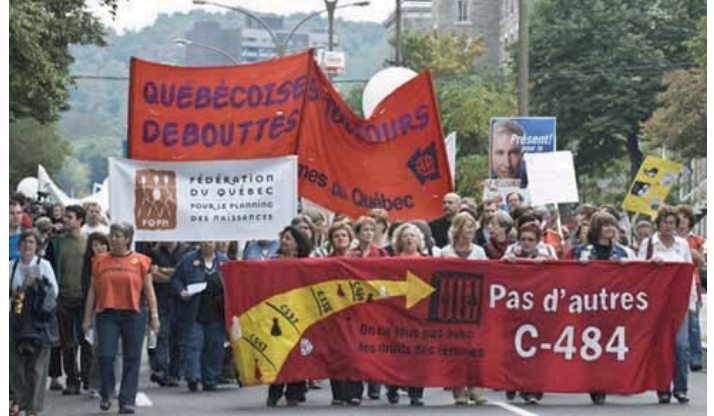
Demonstrators rally in Montreal to prevent the re-election of the Conservatives and to protest against Bill C-484.

Bill C-484 is not necessary. The law already allows judges to apply harsher penalties when a pregnant woman is attacked, and judges do so. The bills' only purpose is to establish the fetus as a legal person and a victim of a crime, separate from the woman. This is a major change to the Criminal Code definition of human being, which